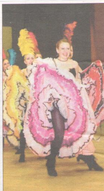
Kankán ocenili nejenom přítomní páni.