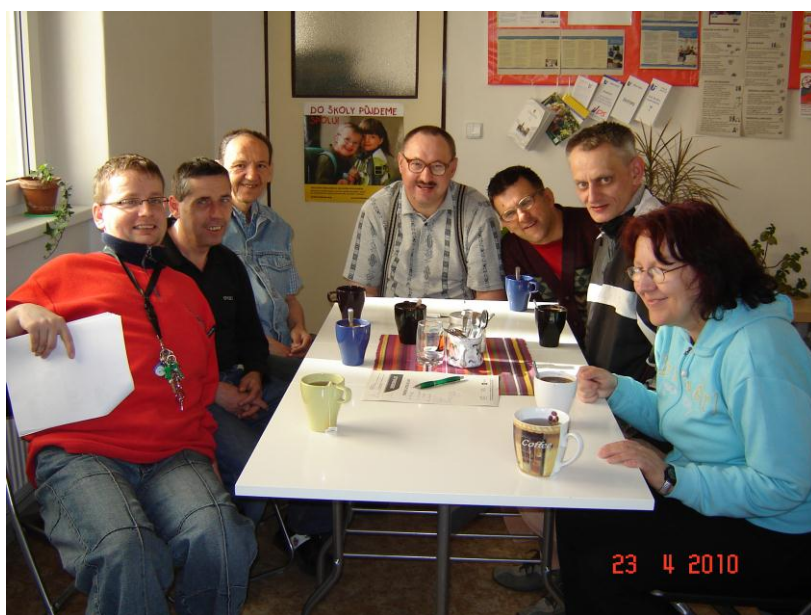
Skupina sebeobhájců (Kutná Hora)