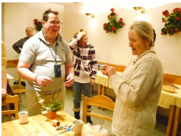
Vánoční dílny (Benešov)