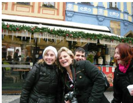
▲ vánoční Staroměstské náměstí, Praha