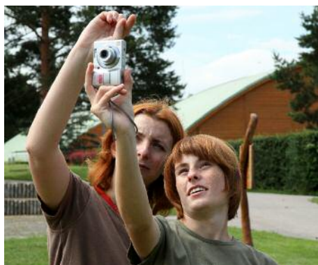
▲ ▲ ZOO, Praha