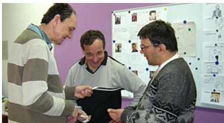
▲ Kurz sociálních dovedností